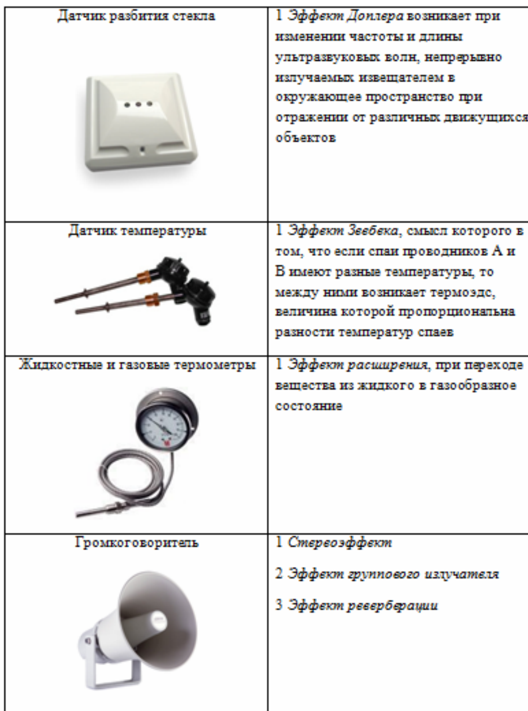
Рисунок 6. Примеры эффектов для межотраслевого оборудования

Приведена таблица с часто используемым оборудованием центра и используемыми эффектами к нему (Рисунок 6). Многие датчики построены на одном и том же принципе (эффекте), что еще раз доказывает, что инвариантное моделирование и метод компактного представления громоздкого описания оборудования актуален для любой отрасли промышленности.